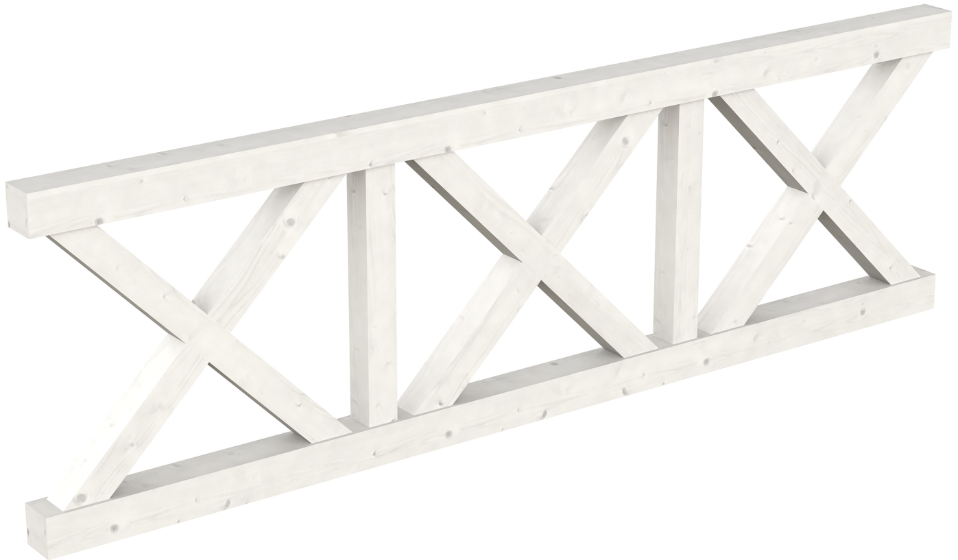
Produktbild AK-Brüstung 270cm