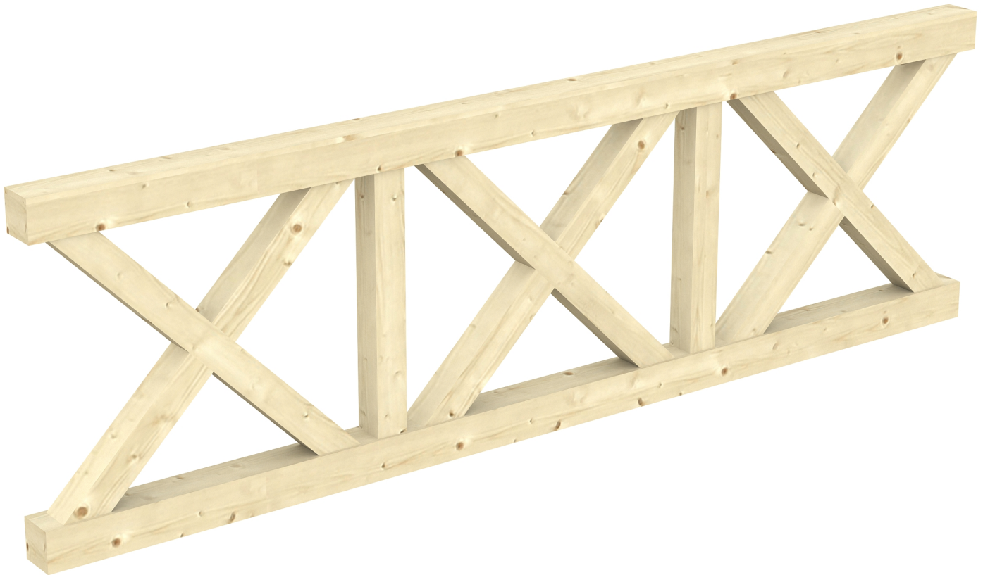
Produktbild AK-Brüstung 270cm