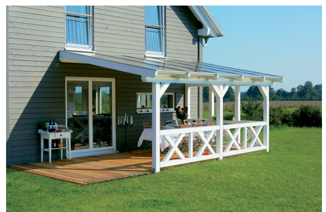
Kundenfoto: Terrassenüberdachung weiss mit 2 Brüstungen und Seitenwand