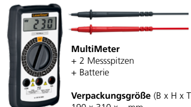
MultiMeter + 2 Messspitzen + Batterie