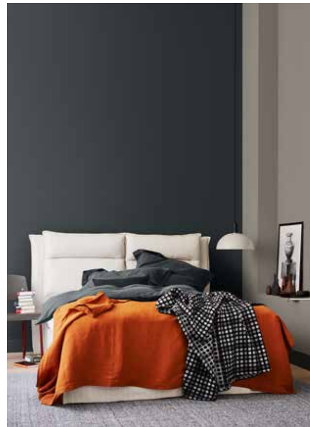
Bild links: SCHÖNER WOHNEN-Kollektion 2018; Bild rechts: Silke Zander, Picture Press; Leuchte: impression.de; Zeitungsständer: Ikarus.de; Wandbild und Sessel: SCHÖNER WOHNEN-Shop