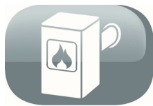
salida de aire trasero