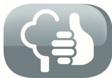
Respetuoso del medio ambiente