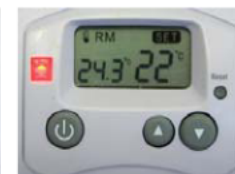
Abb. B: Modus Heizbetrieb in eingeschaltetem Zustand, Verbraucher nicht eingeschaltet, da SOLL-Temperatur unterhalb der IST-Temperatur