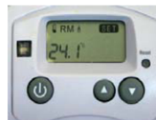
Abb. A: Modus Heizbetrieb im ausgeschalteten Zustand