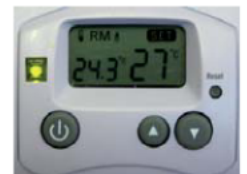
Abb. C: Modus Heizbetrieb in eingeschaltetem Zustand, Verbraucher eingeschaltet, da IST-Temperatur unterhalb der SOLL-Temperatur