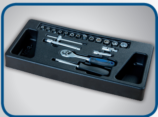
13 STK. STECKSCHLÜSSELEINSÄTZE 4 mm – 14 mm