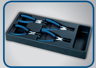
4 STK. SICHERUNGSRINGZANGEN 2 Stk. für Innenringe 2 Stk. für Außenringe