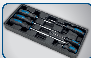
6 STK. KREUZSCHRAUBENZIEHER PH1 x 100, PH2 x 100, PH2 x 150, PH0 x 75, PH3 x 200, PH2 x 38