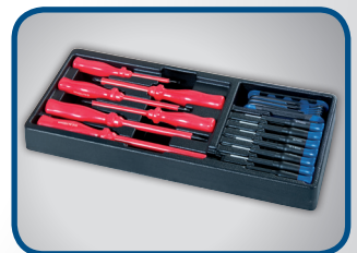
6 STK. ISOLIERTE SCHRAUBENZIEHER (-) 3 x 75, 4 x 100, 5,5 x 125 / (+) PH0 x 75, PH1 x 100, PH2 x 100