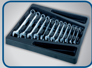
GABELRINGSCHLÜSSEL 12 stk.