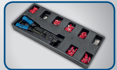
CRIMP-SET 200 mm, 160 Stk.