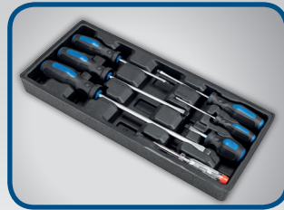
6 STK. SCHLITZSCHRAUBENZIEHER 1 x Phasenprüfer, 4 x 100, 5 x 100, 3 x 75, 6 x 150, 6 x 38, 8 x 200