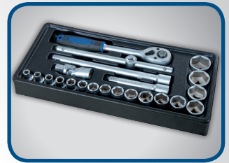
17 STK. STECKSCHLÜSSELEINSÄTZE 10 mm – 32 mm