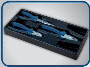
3 STK. ZANGEN 1 Stk. Spitzzange 1 Stk. Seitenschneider 1 Stk. Kombizange