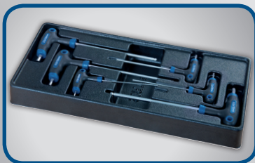
INNENSECHSKANTSCHLÜSSEL MIT KUGELKOPF 2 x 100 mm, 2,5 x 100 mm, 3 x 100 mm, 4 x 150 mm, 5 x 150 mm, 6 x 150 mm,