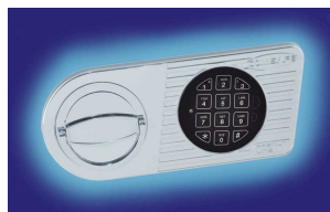
Elektronischschloss mit Klappgriff