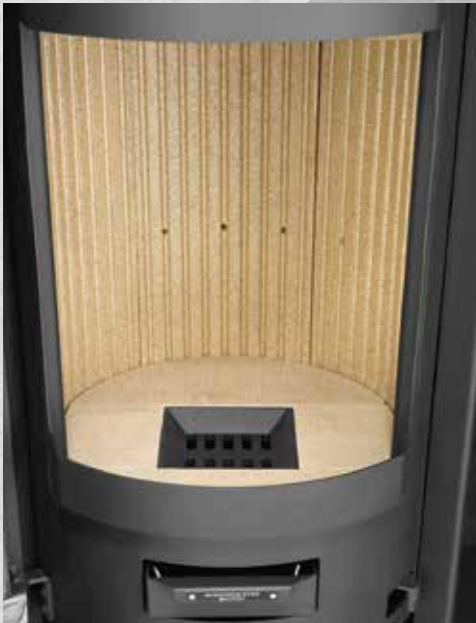
Brennraum mit Vermiculiteplatten

Gerissene Vermiculiteplatten brauchen zunächst nicht ersetzt werden. Erst wenn der darunterliegende Metallkorpus frei liegt, muss getauscht werden. Vermiculiteplatten sind asbestfrei und ungiftig.