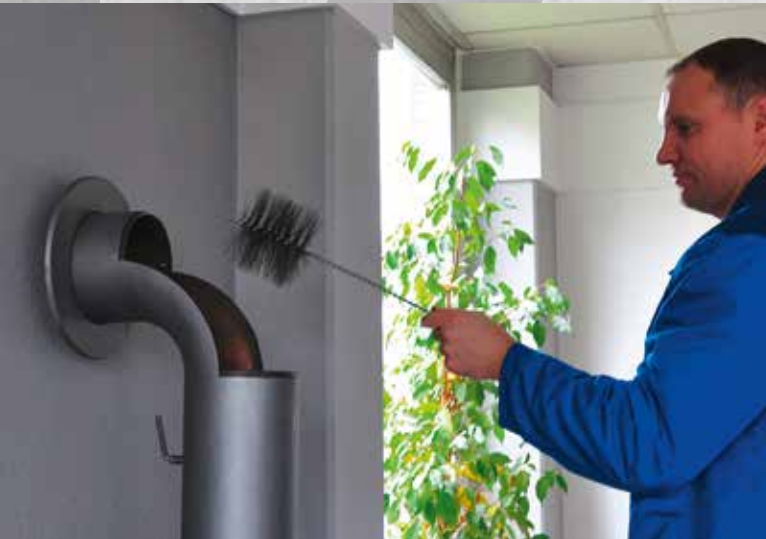
Kehren des Rauchrohrs

Die Wartung des Kaminofens ist naturgemäß abhängig von der Menge an verfeuertem Brennstoff. Grundsätzlich sollte am Ende der Heizsaison das Rauchrohr mit einer entsprechenden Rohrbürste durchgekehrt und Ascheablagerungen an den über der Brennkammer befindlichen Umlenkungen mit einem geeigneten Staubsauger abgesaugt werden. Türdichtungen und Feuerraumauskleidung sollten einer Sichtprüfung unterzogen werden.