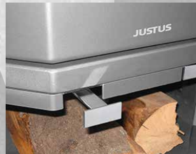
Die Luftschieberstellungen entnehmen Sie Ihrer Bedienungsanleitung

Bei den klassischen handbeschickten Kaminöfen unterscheidet man zunächst zwischen der Primärluft, die von unten durch den Ascherost dem Verbrennungsgut zugeführt wird, und der Sekundärluft beziehungsweise Tertiärluft, die von oben oder hinten zugeführt wird. Die Luftschieber steuern die jeweilige Verbrennungsluftmenge. Die Primärluft wird insbesondere zum Anzünden benötigt. In der Vollbrandphase sollte sie möglichst weit geschlossen werden. Auch zur Verbrennung von Braunkohlebriketts wird verstärkt Primärluft benötigt. Wie die einzelnen Luftschieber für eine optimale Verbrennung zu betätigen sind, entnehmen Sie bitte der Bedienungsanleitung Ihres Geräts!