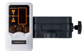
RangeXtender RX 30 inklusive Universalhalterung + Batterien

Verpackungsgröße (B x H x T) 190 x 310 x 60 mm