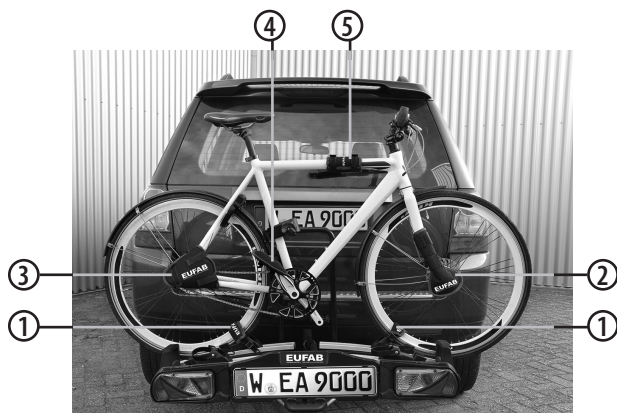
Figura 1: Panoramica