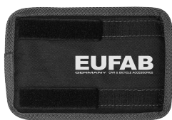
Figura 10: Protezione telaio