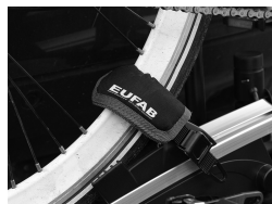
Figura 3: Protezione cerchi applicata alla cinghia di fissaggio