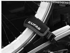
Figure 3: Rim guards mounted to securing strap