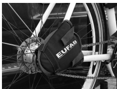
Figure 7 : Monter la protection de chaîne