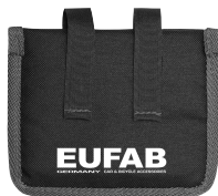
Figura 8: Protezione pedali