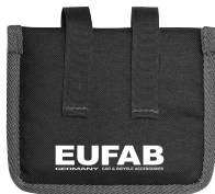
Figure 8: Pedal guard