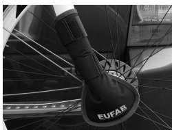
Figura 5: Protezione forcella applicata