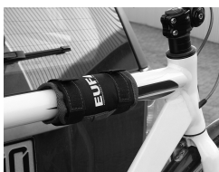
Figura 11: Protezione telaio applicata