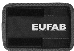
Figure 10: Frame guard