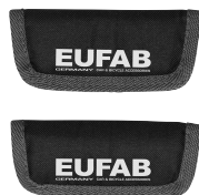
Figura 2: Protezione cerchi