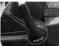
Figure 4 : Protection de fourche