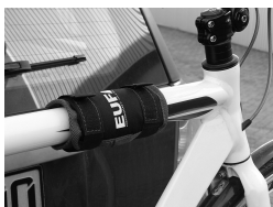
Figure 11: Mounted frame guard