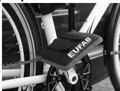
Figura 9: Protezione pedali applicata