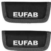
Figure 2: Rim guards