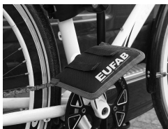
Figure 9 : Monter la protection de pédales