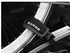
Figure 2 : Protection de jantes