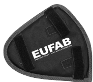
Figura 6: Protezione catena