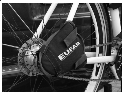
Figura 7: Protezione catena applicata