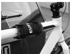
Figure 11 : Monter la protection de cadre