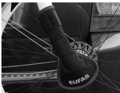
Figure 5: Mounted fork guard