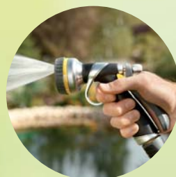
9 Gut wässern