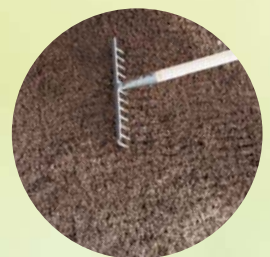
5 Fein abharken