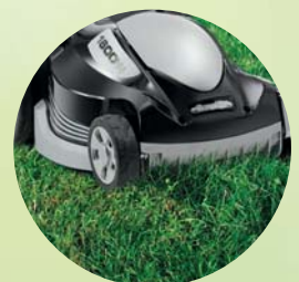
10 Erster Rasenschnitt bei 10-12 cm