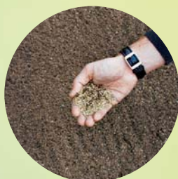
7 Kreuz und quer Säen