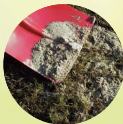
3 Abmagern mit Sand