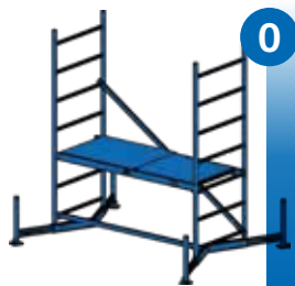
Grundgerüst Art.-No. 710116