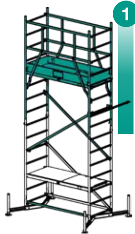
1. Aufstockung Grundgerüst Art.-No. 710123 Art.-No. 710116