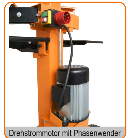
Drehstrommotor mit Phasenwender