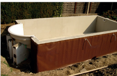
Abdichten der Außenseite zum Schutz beim Hinterfüllen