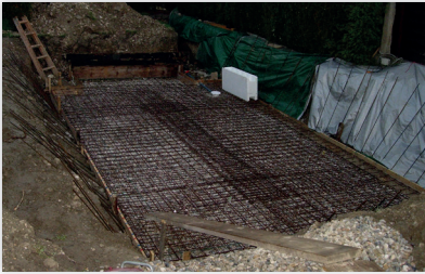
Erstellung der Fundamentplatte mit Eisenarmierung