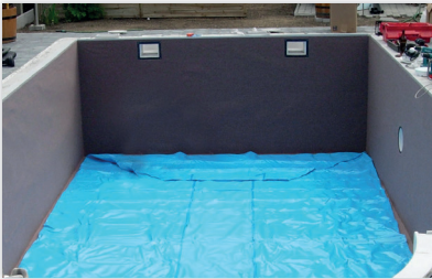
Montage der Schwimmbadfolie