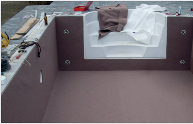
Vollflächige Verlegung des Spezialvlies