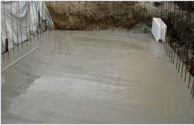
Fundamentplatte fertig betoniert