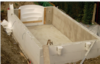
Befüllt mit Beton, inkl. Einbauteile und eingebauter Treppe