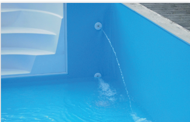
Befüllung des Beckens mit Wasser