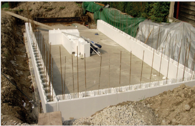
Beginn des Aufbaues der Styroporsteine