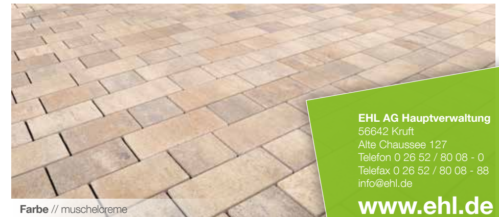
Farbe // muschelcreme

Verlegebeispiele zum jeweiligen Produkt finden Sie auf www.ehl-for-diy.de