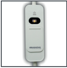
Die benutzerfreundliche Steuerung