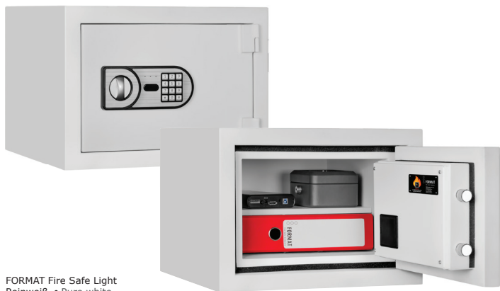
FORMAT Fire Safe Light Reinweiß • Pure white Dekoration nicht im Lieferumfang enthalten • decoration not included in the delivery