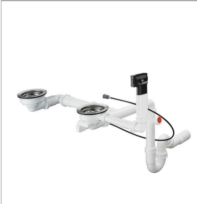
Ilustración del producto